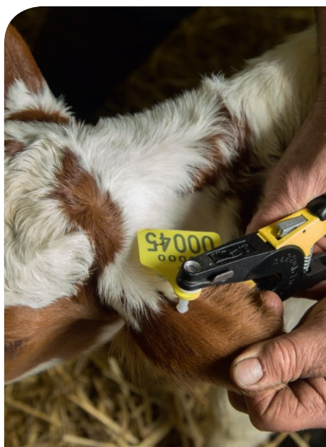
In de periode 1 april 2016 – 31 december 2016 ontvangen veehouders 3 euro korting (per biopt) op de onderzoekskosten van BVD Oorbiopten bij GD.