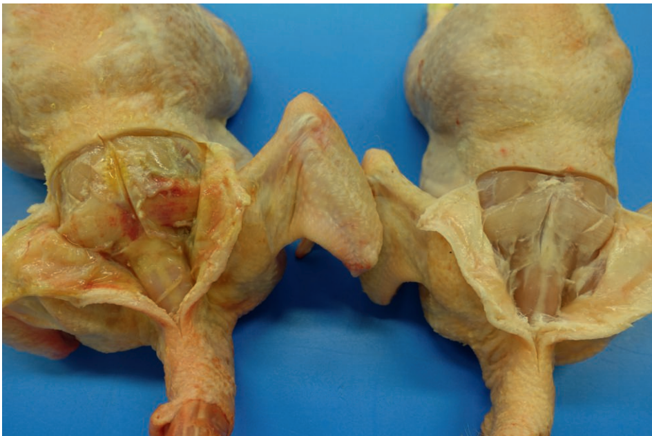
Foto 1. De huid van deze twee karkassen is geopend: op de onderliggende spieren is bij het linker karkas rugspier necrose te zien, het rechter karkas vertoont geen afwijkingen

Rugspier necrose is ernstige afsterving van de musculus latissimus dorsi , een rugspier van de kip. Dit wordt ook wel beschreven als 'dorsal cranial myopathy'. Er zijn geen aanwijzingen dat hier een infectieuze oorsprong voor is. De exacte ontstaanswijze is nog niet bekend evenals de incidentie van het probleem in Nederland, maar het lijkt niet puur incidenteel te zijn.